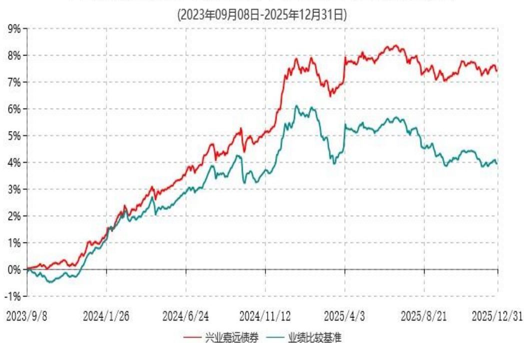
兴业嘉远债券型证券投资基金累计净值增长率与业绩比较基准收益率历史走势对比图