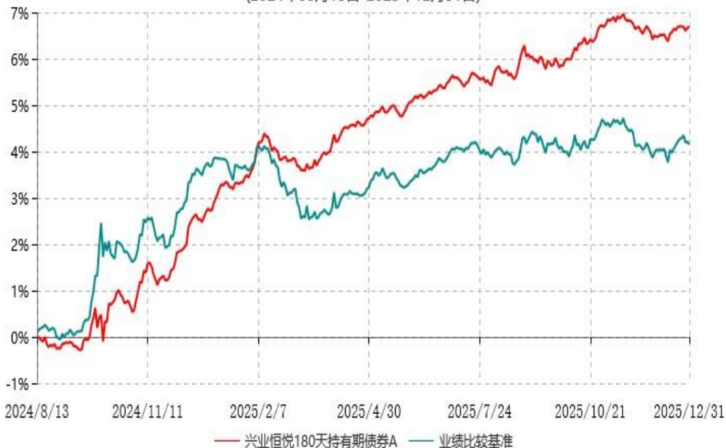
兴业恒悦180天持有期债券A累计净值增长率与业绩比较基准收益率历史走势对比图 (2024年08月13日-2025年12月31日)

注：根据本基金基金合同规定，基金管理人自基金合同生效之日起6个月内已使基金的投资组合比例符合基金合同的有关约定。