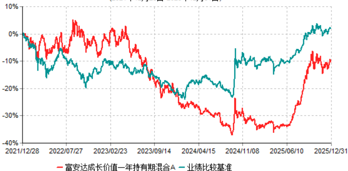
富安达成长价值一年持有期混合A累计净值增长率与业绩比较基准收益率历史走势对比图 (2021年12月28日-2025年12月31日)