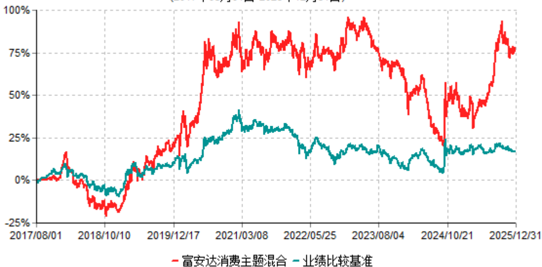
富安达消费主题混合累计净值增长率与业绩比较基准收益率历史走势对比图 (2017年08月01日-2025年12月31日)

注：本基金原业绩比较基准为：沪深300指数收益率*60%+中债总指数收益率*40%，修订后的业绩比较基准为：中证内地消费主题指数收益率*60%+中债总指数收益率*40%，修改后的业绩比较基准生效日为2023年7月25日。