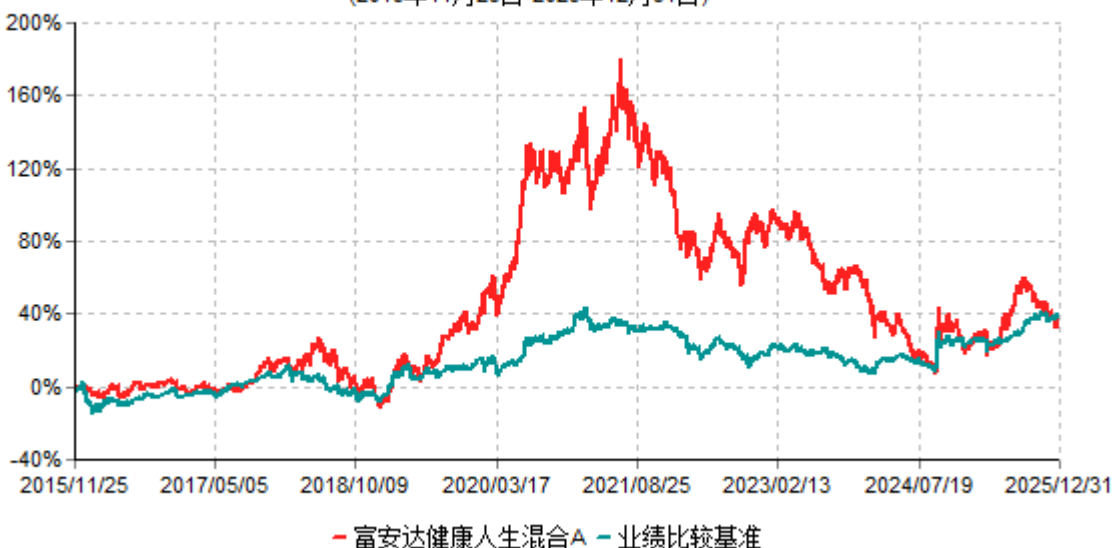
富安达健康人生混合A累计净值增长率与业绩比较基准收益率历史走势对比图 (2015年11月25日-2025年12月31日)