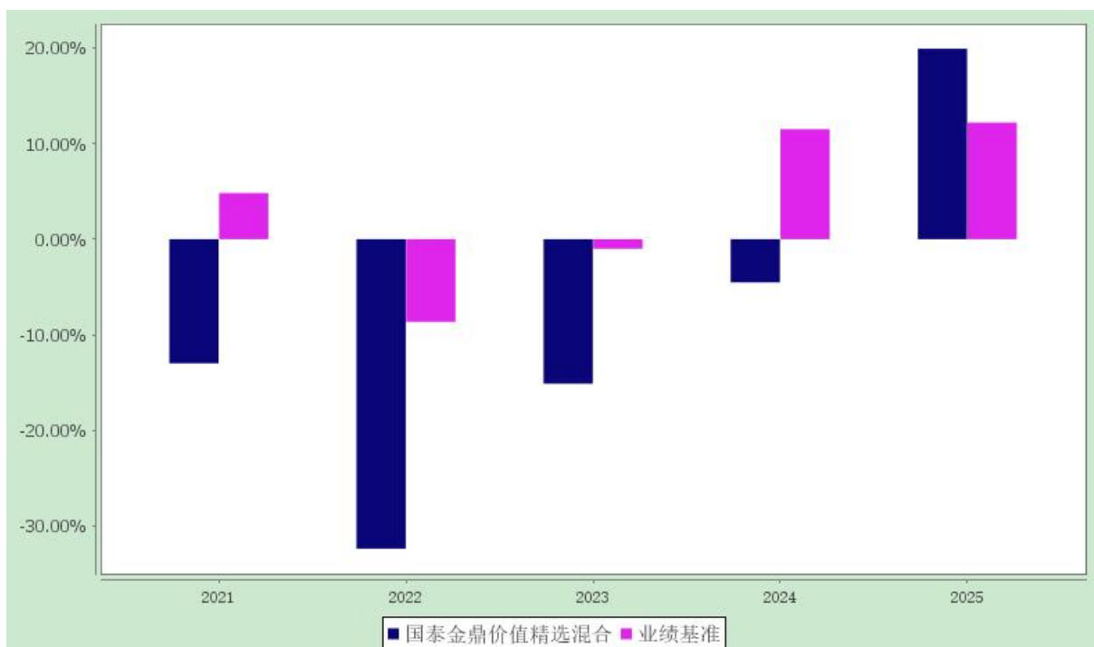
过去五年基金净值增长率与业绩比较基准收益率的对比图