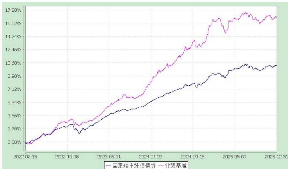
自基金合同生效以来份额累计净值增长率与业绩比较基准收益率的历史走势对比图 (2022 年 2 月 15 日至 2025 年 12 月 31 日)

注：本基金合同生效日为 2022 年 2 月 15 日。本基金在六个月建仓期结束时，各项资产配置比例符合合同约定。