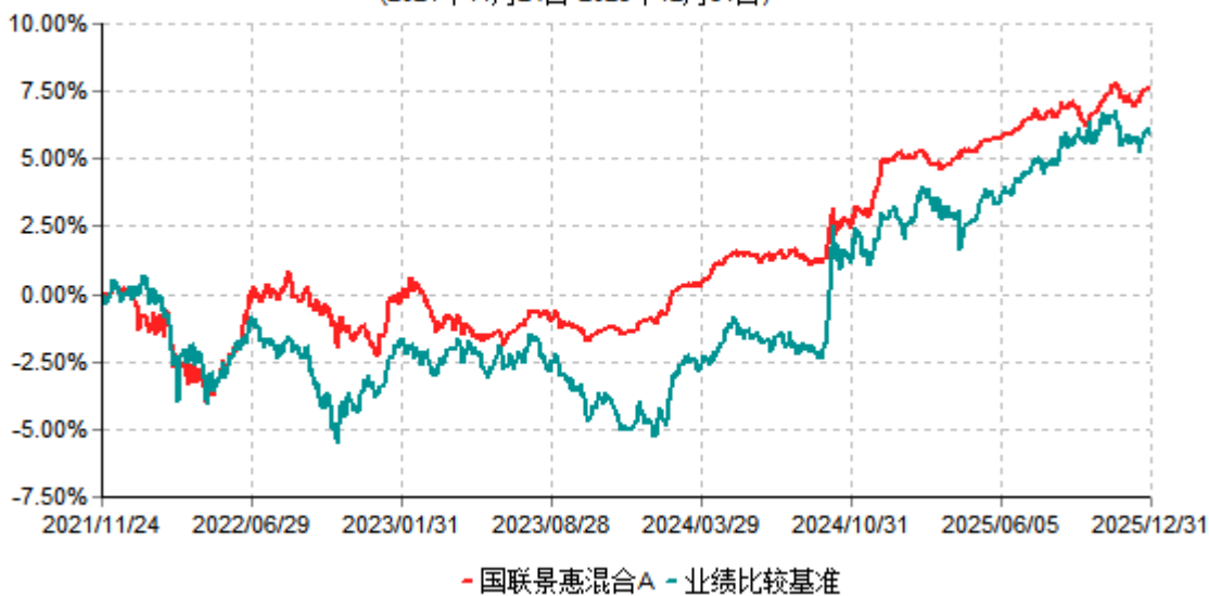
国联景惠混合A累计净值增长率与业绩比较基准收益率历史走势对比图 (2021年11月24日-2025年12月31日)