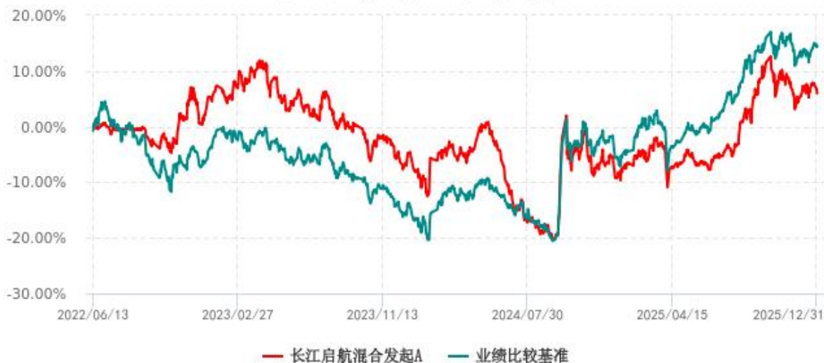
长江启航混合发起A累计净值增长率与业绩比较基准收益率历史走势对比图 (2022年06月13日-2025年12月31日)

注：本基金的业绩比较基准自 2024 年 10 月 9 日起由“中证 800 指数收益率*80%+中债综合指数收益率*20%”变更为“中证 800 指数收益率*60%+中证港股通综合指数收益率*20%+中债综合指数收益率*20%”。