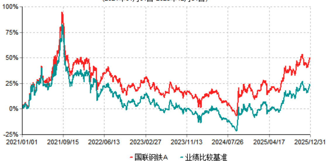
国联钢铁A累计净值增长率与业绩比较基准收益率历史走势对比图 (2021年01月01日-2025年12月31日)