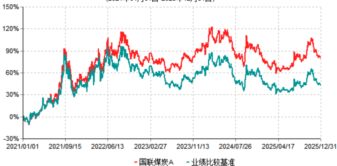
国联煤炭A累计净值增长率与业绩比较基准收益率历史走势对比图 (2021年01月01日-2025年12月31日)