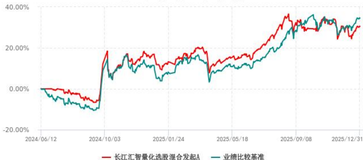
长江汇智量化选股混合发起A累计净值增长率与业绩比较基准收益率历史走势对比图 (2024年06月12日-2025年12月31日)