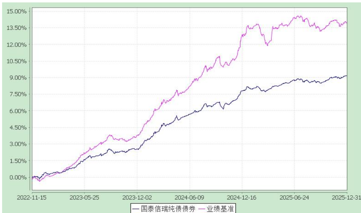
自基金合同生效以来份额累计净值增长率与业绩比较基准收益率的历史走势对比图 (2022 年 11 月 15 日至 2025 年 12 月 31 日)

注：本基金合同生效日为 2022 年 11 月 15 日，在六个月建仓期结束时，各项资产配置比例符合合同约定。