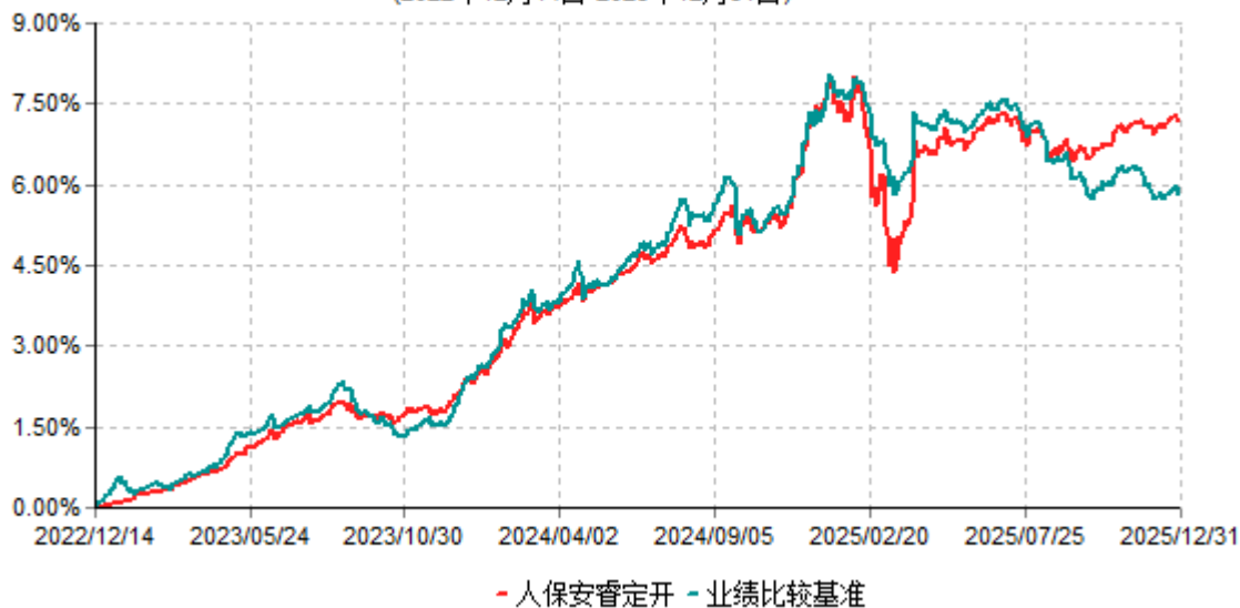
人保安睿定开累计净值增长率与业绩比较基准收益率历史走势对比图 (2022年12月14日-2025年12月31日)