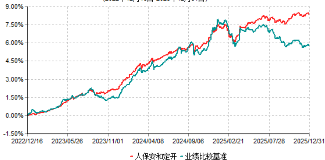
人保安和定开累计净值增长率与业绩比较基准收益率历史走势对比图 (2022年12月16日-2025年12月31日)