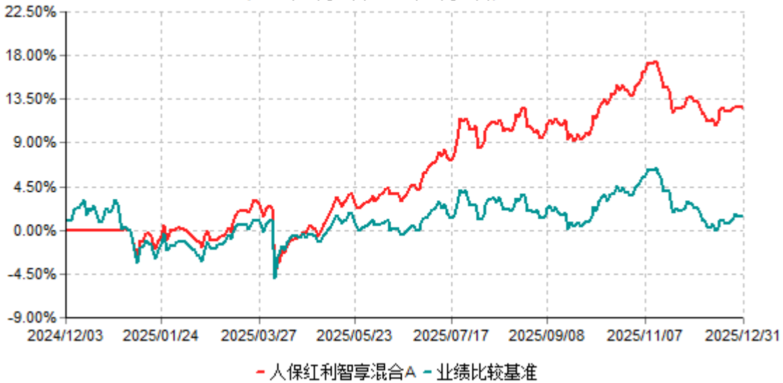
人保红利智享混合A累计净值增长率与业绩比较基准收益率历史走势对比图 (2024年12月03日-2025年12月31日)