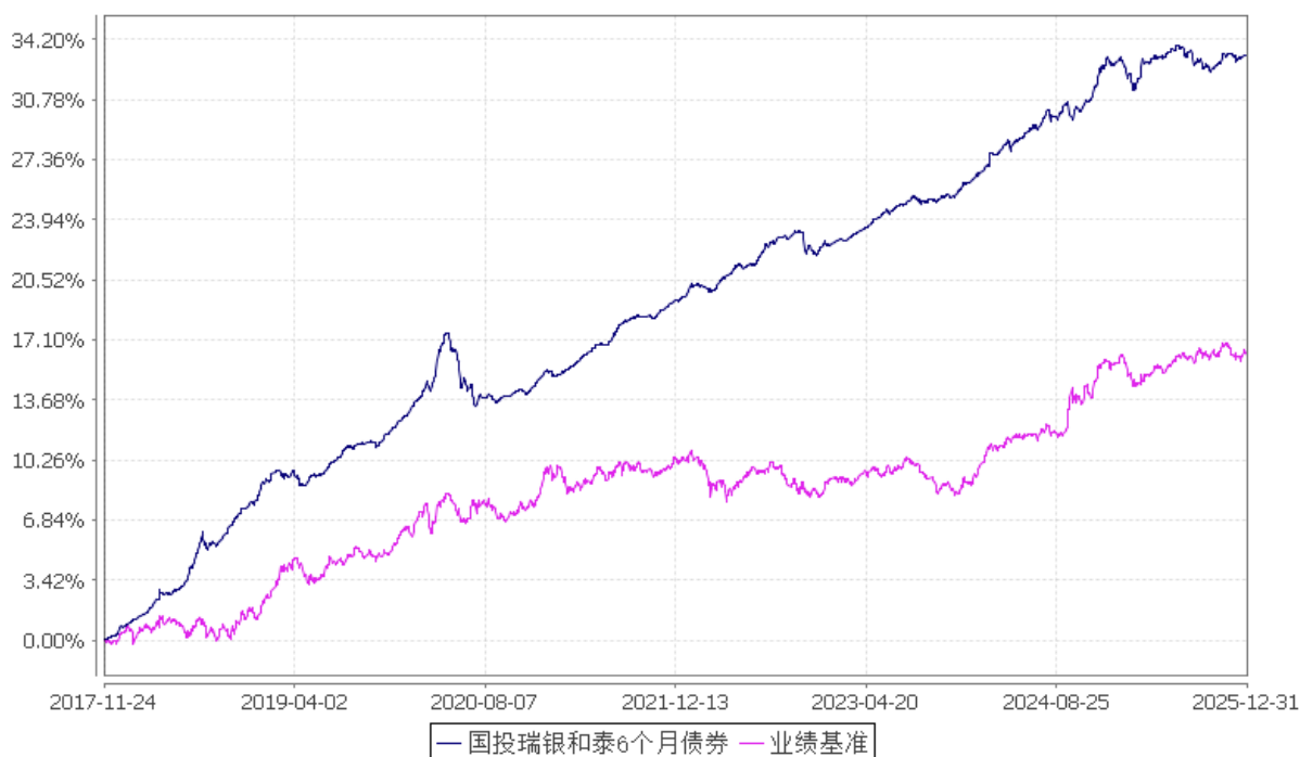
国投瑞银和泰 6 个月定期开放债券型发起式证券投资基金 份额累计净值增长率与业绩比较基准收益率的历史走势对比图 (2017 年 11 月 24 日至 2025 年 12 月 31 日)