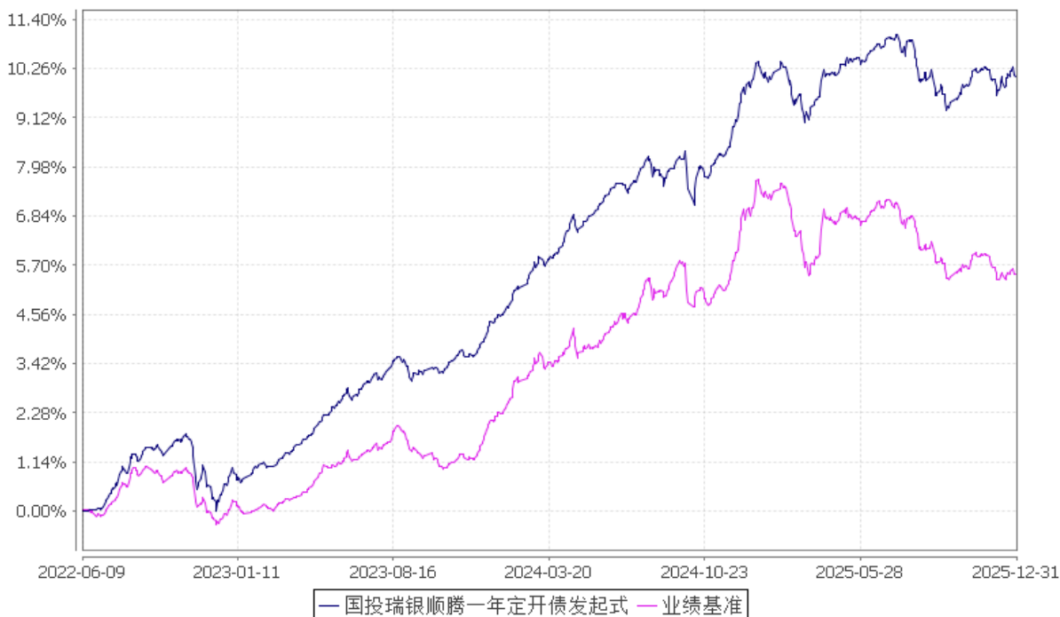
国投瑞银顺腾一年定期开放债券型发起式证券投资基金 份额累计净值增长率与业绩比较基准收益率的历史走势对比图 (2022年6月9日至2025年12月31日)