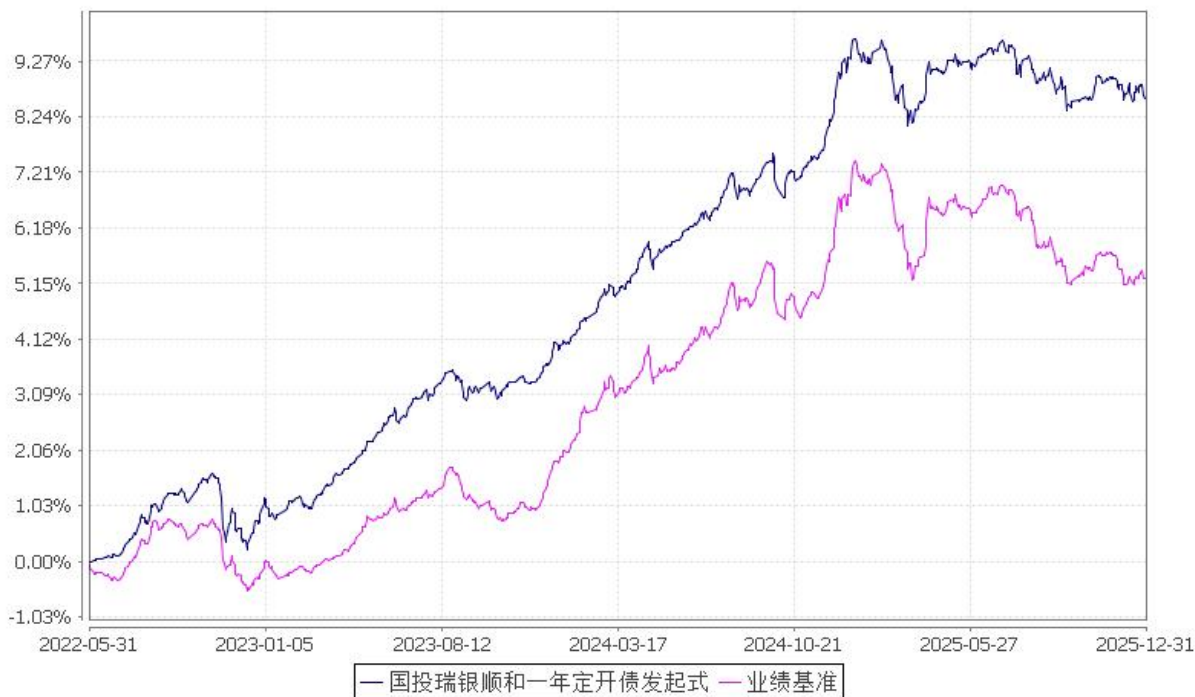
国投瑞银顺和一年定期开放债券型发起式证券投资基金 份额累计净值增长率与业绩比较基准收益率的历史走势对比图 (2022年5月31日至2025年12月31日)