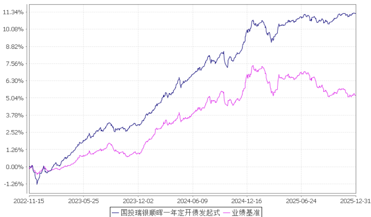
国投瑞银顺晖一年定期开放债券型发起式证券投资基金 份额累计净值增长率与业绩比较基准收益率的历史走势对比图 (2022 年 11 月 15 日至 2025 年 12 月 31 日)