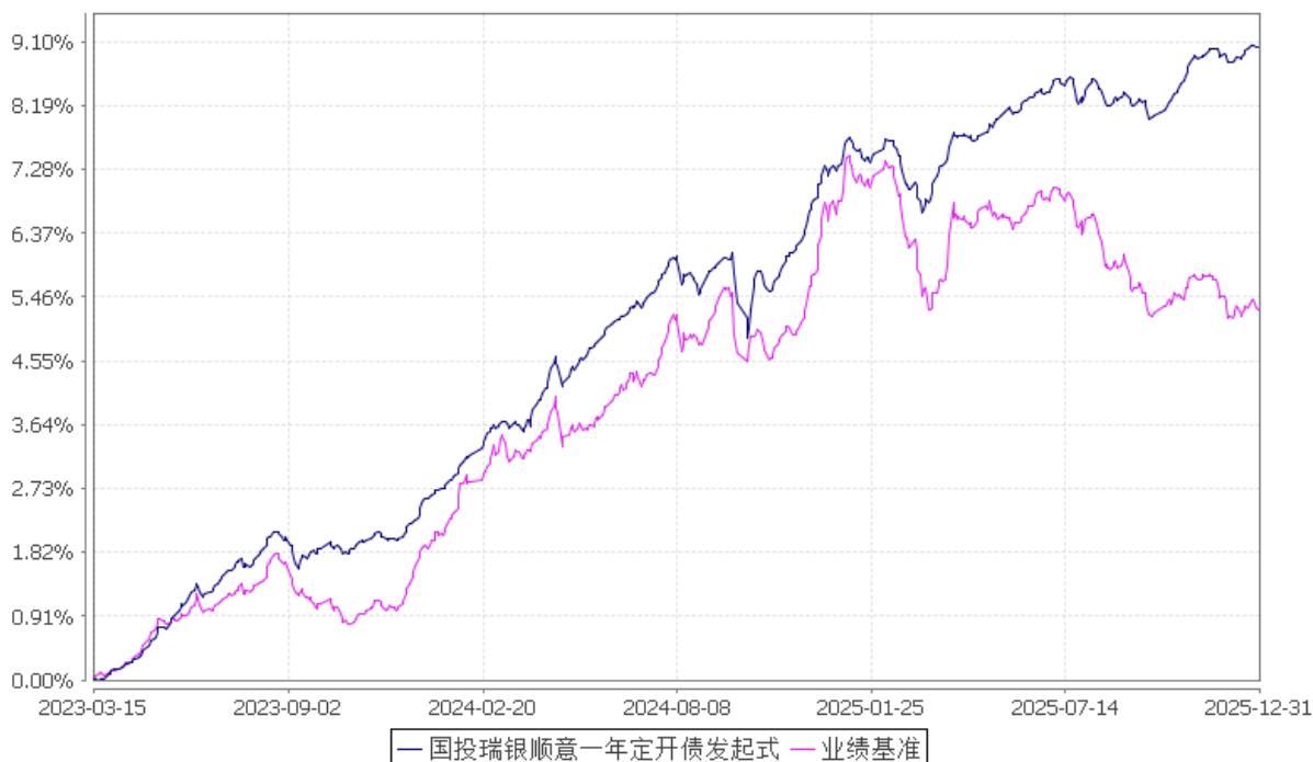
国投瑞银顺意一年定期开放债券型发起式证券投资基金 份额累计净值增长率与业绩比较基准收益率的历史走势对比图 (2023年3月15日至2025年12月31日)