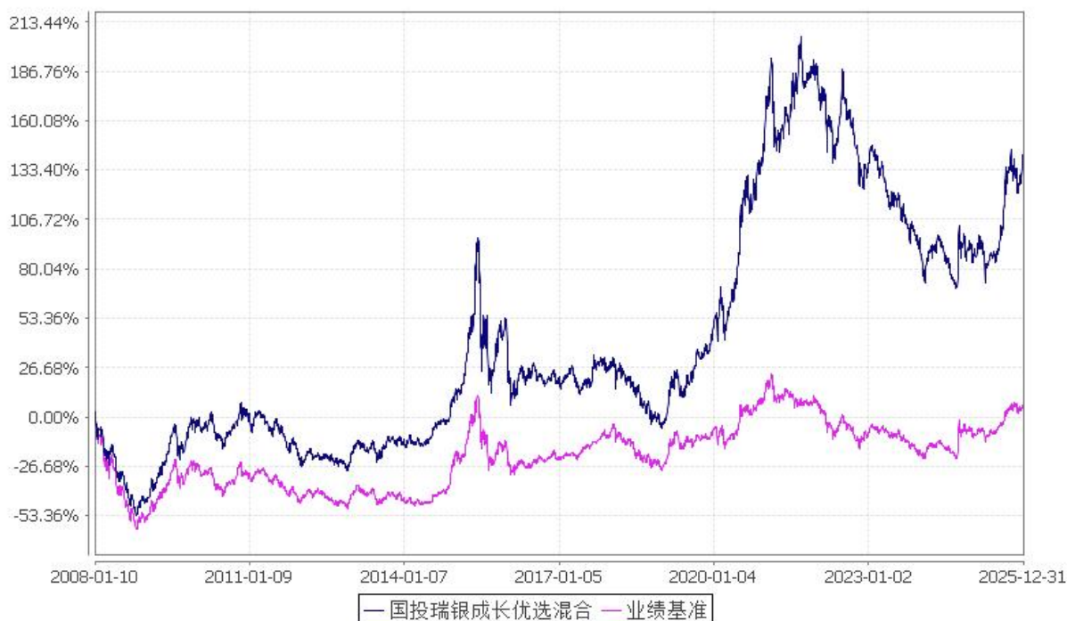
国投瑞银成长优选混合型证券投资基金 份额累计净值增长率与业绩比较基准收益率的历史走势对比图 (2008 年 1 月 10 日至 2025 年 12 月 31 日)