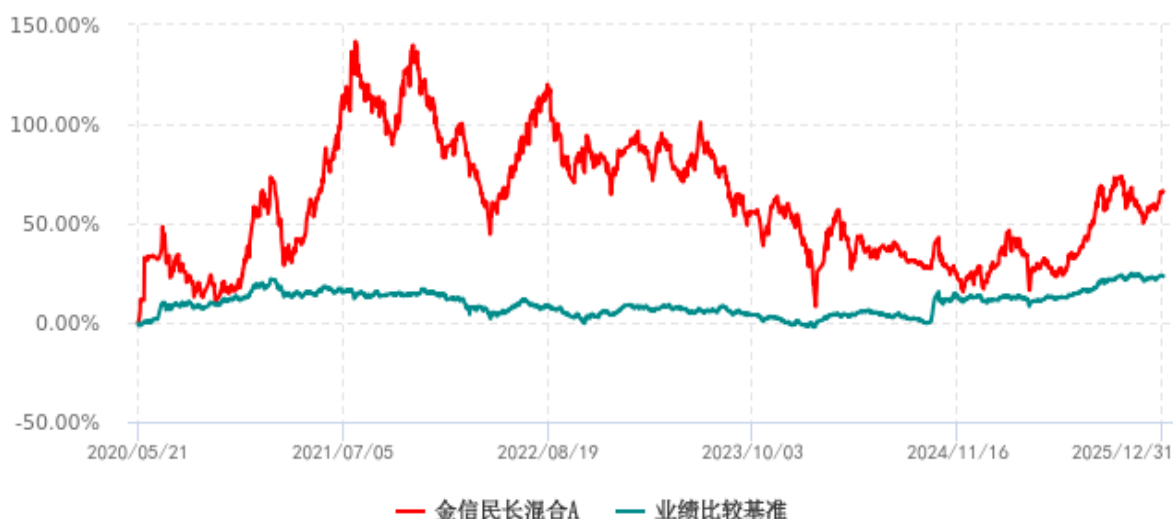
金信民长混合A累计净值增长率与业绩比较基准收益率历史走势对比图 (2020年05月21日-2025年12月31日)