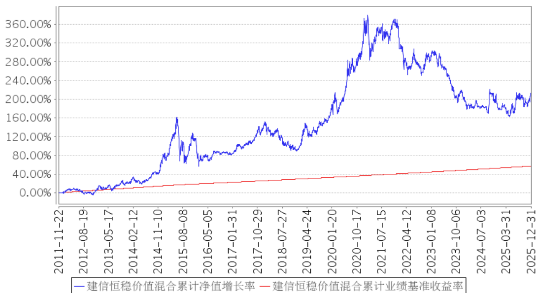
建信恒稳价值混合累计净值增长率与同期业绩比较基准收益率的历史走势对比图