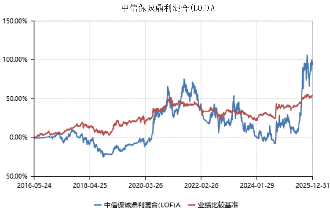
中信保诚鼎利混合 (LOF) C