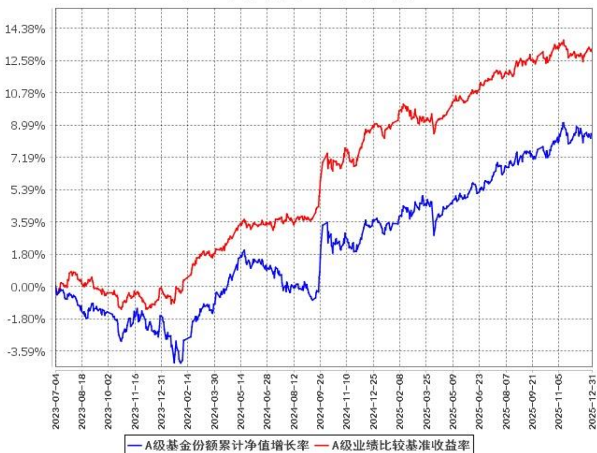
A级基金份额累计净值增长率与同期业绩比较基准收益率的历史走势对比图 (2023年7月4日至2025年12月31日)