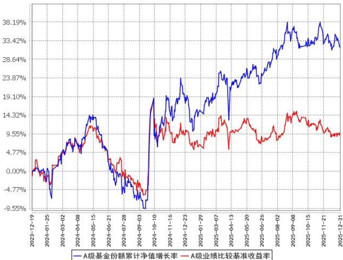
A级基金份额累计净值增长率与同期业绩比较基准收益率的历史走势对比图 (2023年12月19日至2025年12月31日)