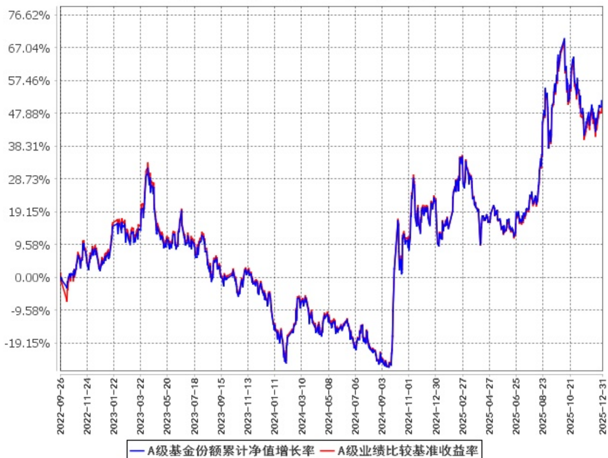
A级基金份额累计净值增长率与同期业绩比较基准收益率的历史走势对比图 (2022年9月26日至2025年12月31日)