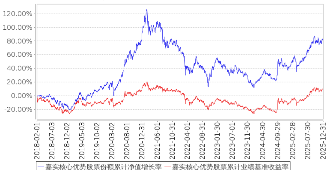
嘉实核心优势股票份额累计净值增长率与同期业绩比较基准收益率的历史走势对比图 (2018年02月01日至2025年12月31日)

注：按基金合同和招募说明书的约定，本基金自基金合同生效日起 6 个月为建仓期，建仓期结束时本基金的各项资产配置比例符合基金合同约定。