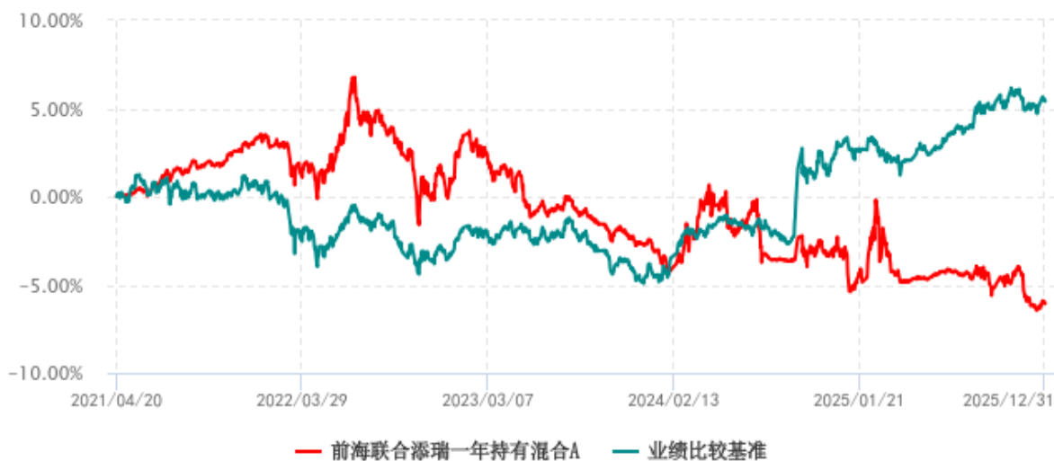
前海联合添瑞一年持有混合A累计净值增长率与业绩比较基准收益率历史走势对比图 (2021年04月20日-2025年12月31日)