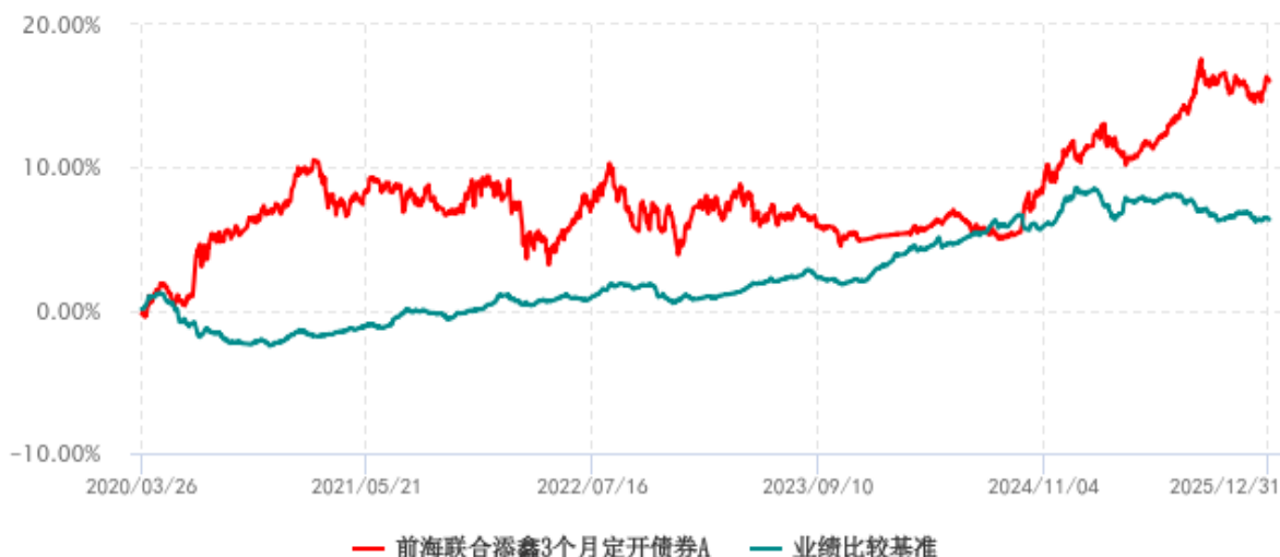
前海联合添鑫3个月定开债券A累计净值增长率与业绩比较基准收益率历史走势对比图 (2020年03月26日-2025年12月31日)