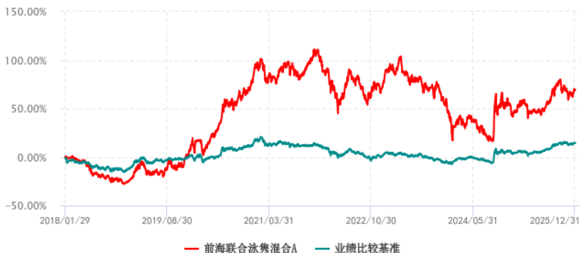
前海联合泳隼混合A累计净值增长率与业绩比较基准收益率历史走势对比图 (2018年01月29日-2025年12月31日)