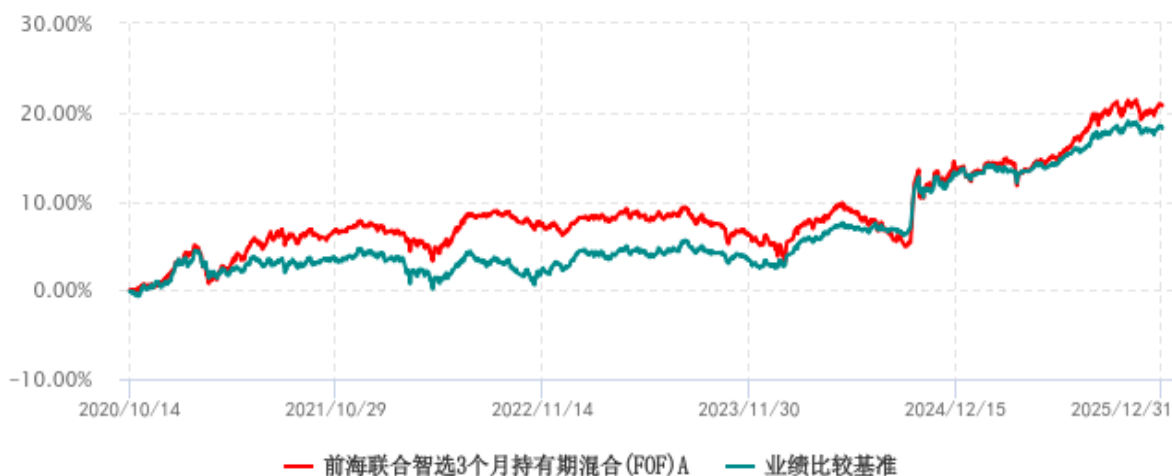
前海联合智选3个月持有期混合 (FOF) A 累计净值增长率与业绩比较基准收益率历史走势对比图 (2020年10月14日-2025年12月31日)