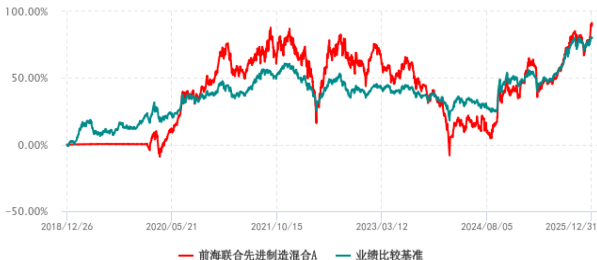
前海联合先进制造混合A累计净值增长率与业绩比较基准收益率历史走势对比图 (2018年12月26日-2025年12月31日)