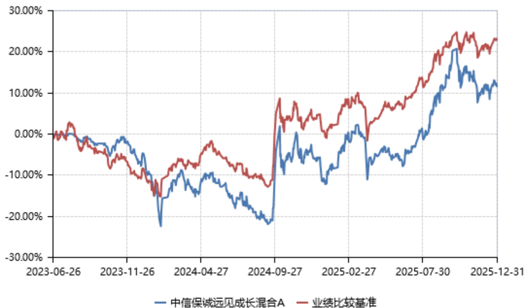
中信保诚远见成长混合 C