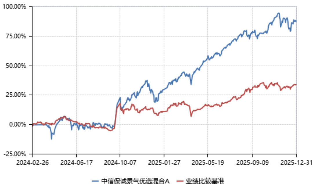
中信保诚景气优选混合 A