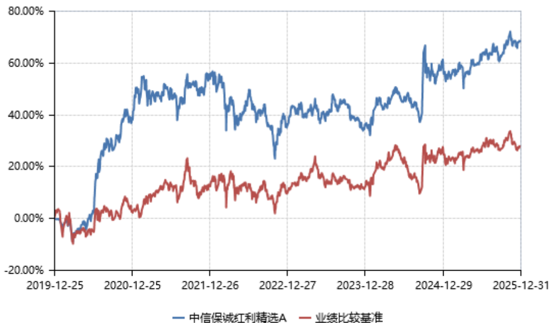
中信保诚红利精选 C