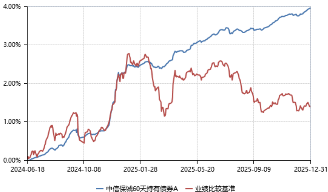
中信保诚 60 天持有债券 C