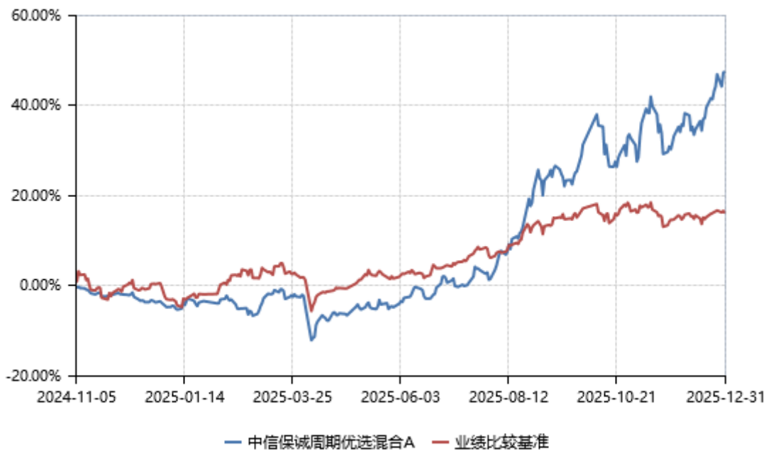
中信保诚周期优选混合 C