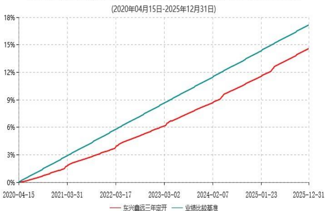
东兴鑫远三年定期开放债券型证券投资基金累计净值增长率与业绩比较基准收益率历史走势对比图

注：1、本基金基金合同生效日为2020年4月15日，根据相关法律法规和基金合同，本基金建仓期为基金合同生效之日起6个月内；