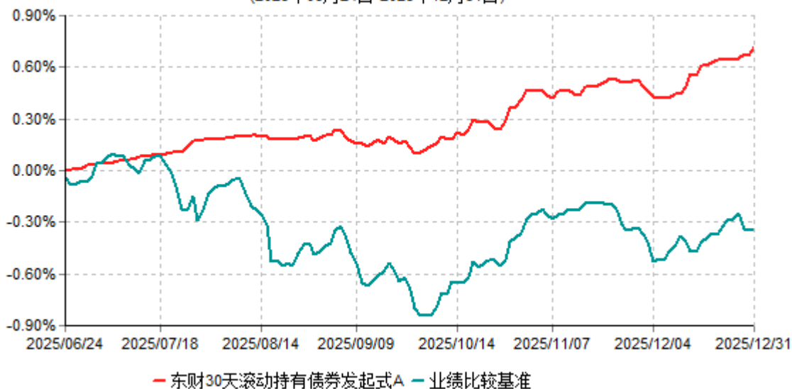
东财30天滚动持有债券发起式A累计净值增长率与业绩比较基准收益率历史走势对比图 (2025年06月24日-2025年12月31日)