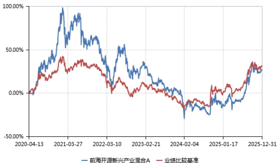
前海开源新兴产业混合 A