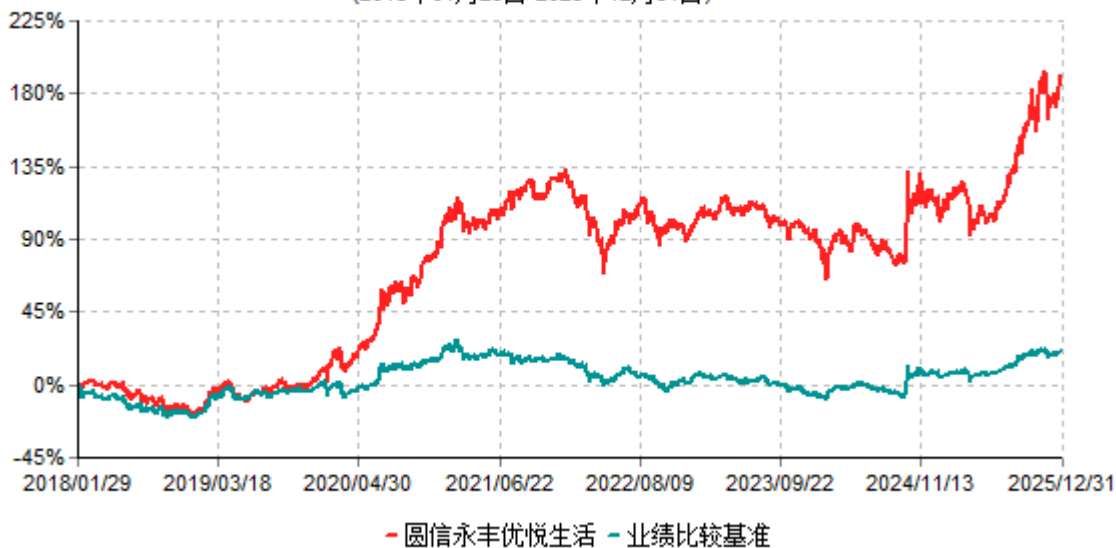
圆信永丰优悦生活累计净值增长率与业绩比较基准收益率历史走势对比图 (2018年01月29日-2025年12月31日)