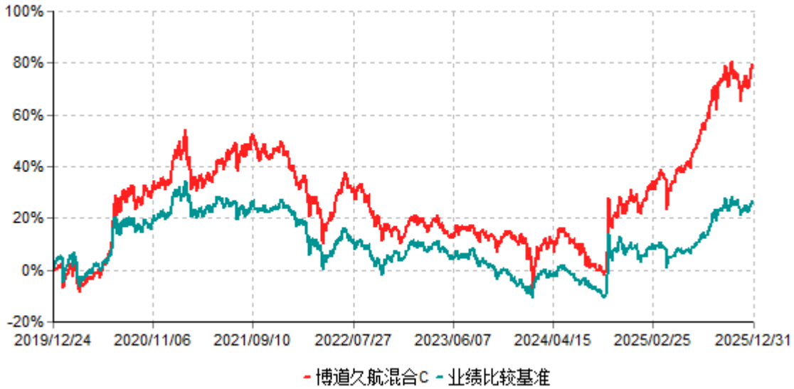
博道久航混合C累计净值增长率与业绩比较基准收益率历史走势对比图 (2019年12月24日-2025年12月31日)

注：本基金建仓期为自基金合同生效日起的6个月。截至建仓期结束，本基金各项资产配置比例符合基金合同及招募说明书有关投资比例的约定。