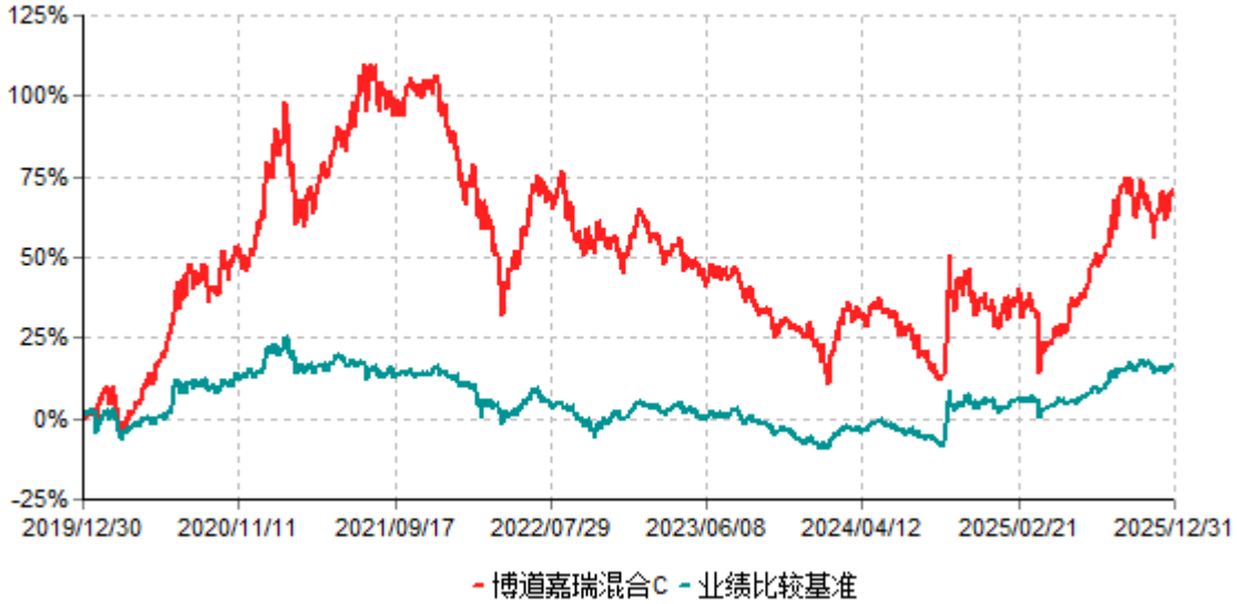
博道嘉瑞混合C累计净值增长率与业绩比较基准收益率历史走势对比图 (2019年12月30日-2025年12月31日)

注：本基金建仓期为自基金合同生效日起的6个月。截至建仓期结束，本基金各项资产配置比例符合基金合同及招募说明书有关投资比例的约定。