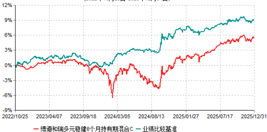
博道和瑞多元稳健6个月持有期混合C累计净值增长率与业绩比较基准收益率历史走势对比图 (2022年10月25日-2025年12月31日)

注：本基金建仓期为自基金合同生效日起的6个月。截至建仓期结束，本基金各项资产配置比例符合基金合同及招募说明书有关投资比例的约定。