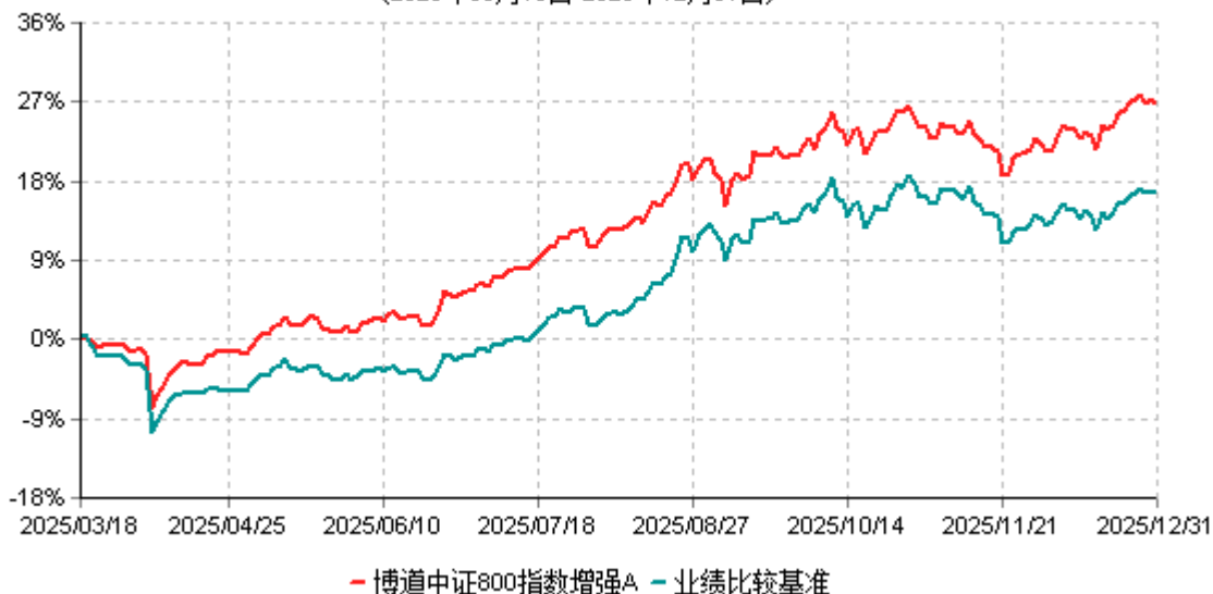
博道中证800指数增强A累计净值增长率与业绩比较基准收益率历史走势对比图 (2025年03月18日-2025年12月31日)

注：本基金基金合同生效日为2025年3月18日，建仓期为自基金合同生效日起的6个月。基金合同生效日至报告期期末，本基金运作时间未满一年。截至建仓期结束，本基金各项资产配置比例符合基金合同及招募说明书有关投资比例的约定。