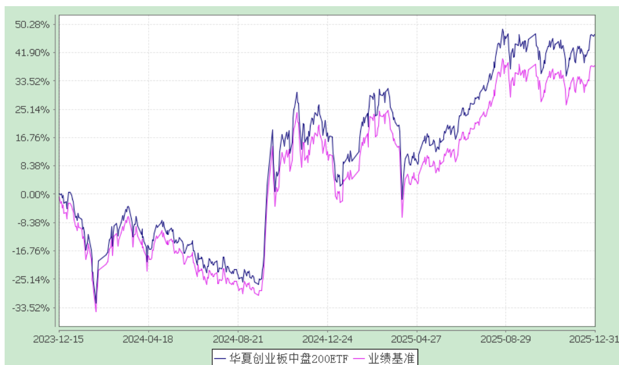
华夏创业板中盘 200 交易型开放式指数证券投资基金 份额累计净值增长率与业绩比较基准收益率历史走势对比图 (2023 年 12 月 15 日至 2025 年 12 月 31 日)