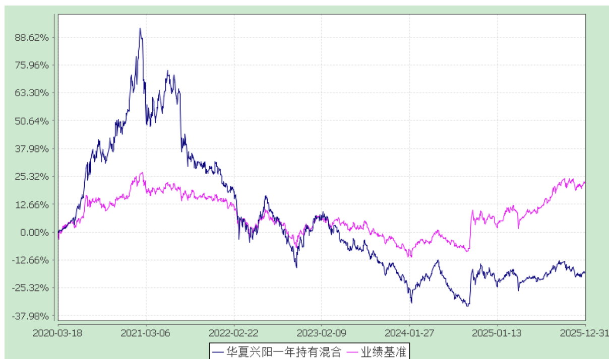
华夏兴阳一年持有期混合型证券投资基金 份额累计净值增长率与业绩比较基准收益率历史走势对比图 (2020年3月18日至2025年12月31日)