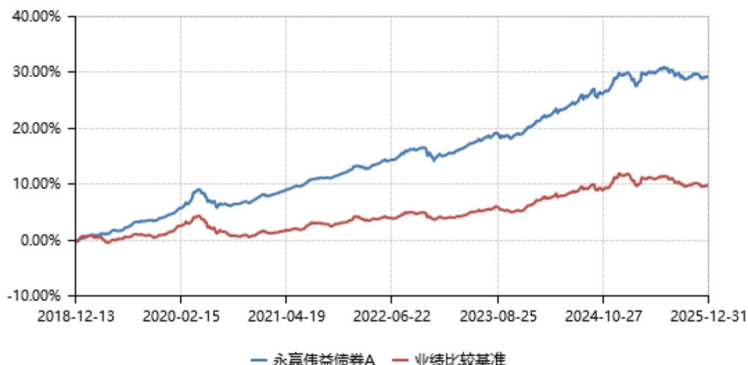
永赢伟益债券A累计净值收益率与业绩比较基准收益率历史走势对比图 (2018年12月13日-2025年12月31日)