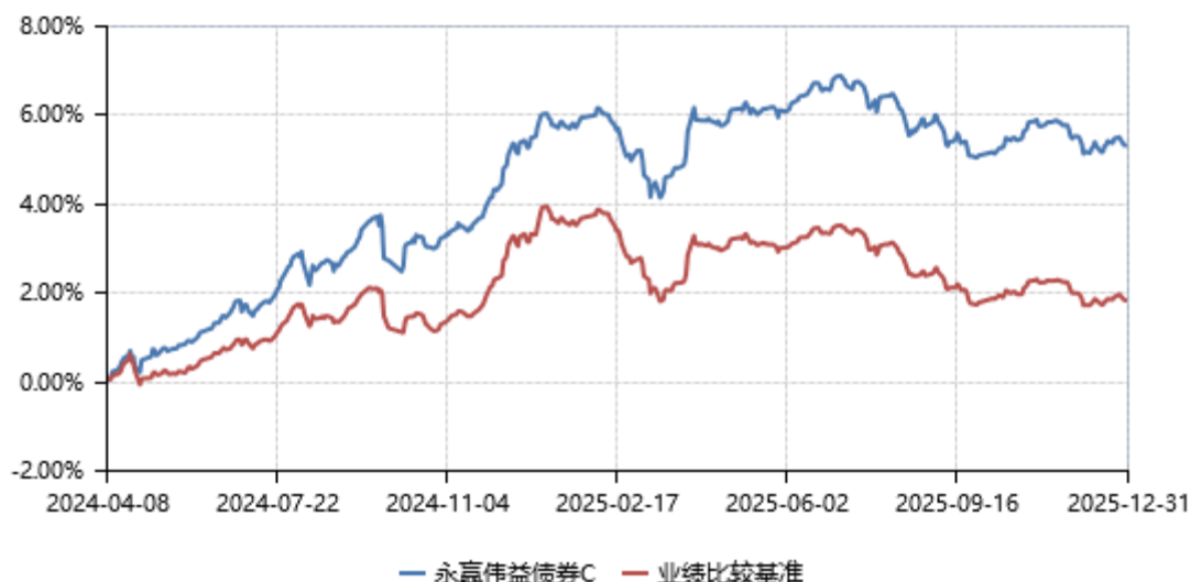
永赢伟益债券C累计净值收益率与业绩比较基准收益率历史走势对比图 (2024年04月08日-2025年12月31日)